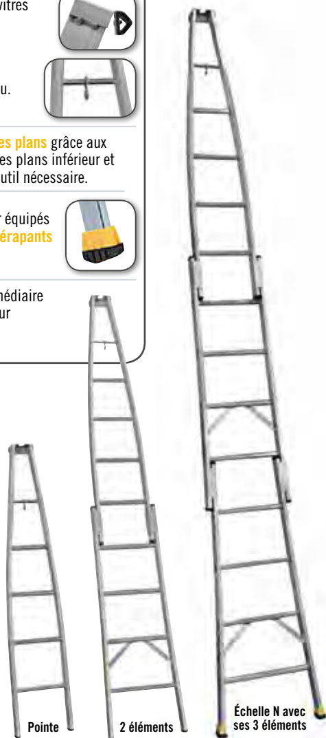
Échelle N avec ses 3 éléments