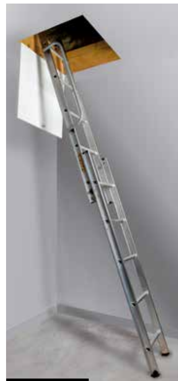
Clic' UP 2 plans