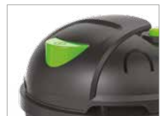
INTERRUPTEUR MARCHÉ/ ARRÊT ACTIONNÉ AVEC LE PIED