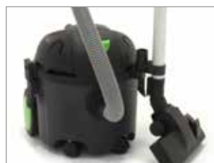
POSITION DE STATIONNEMENT