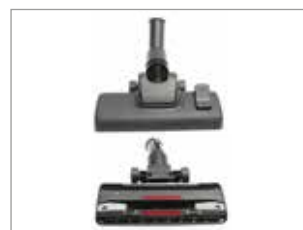
NOUVELLE BROSSE PUISSANTE POUR UNE EFFICACITÉ DE NETTOYAGE ÉLEVÉE