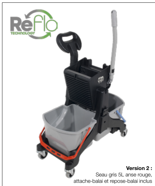
Seau 5L anse rouge